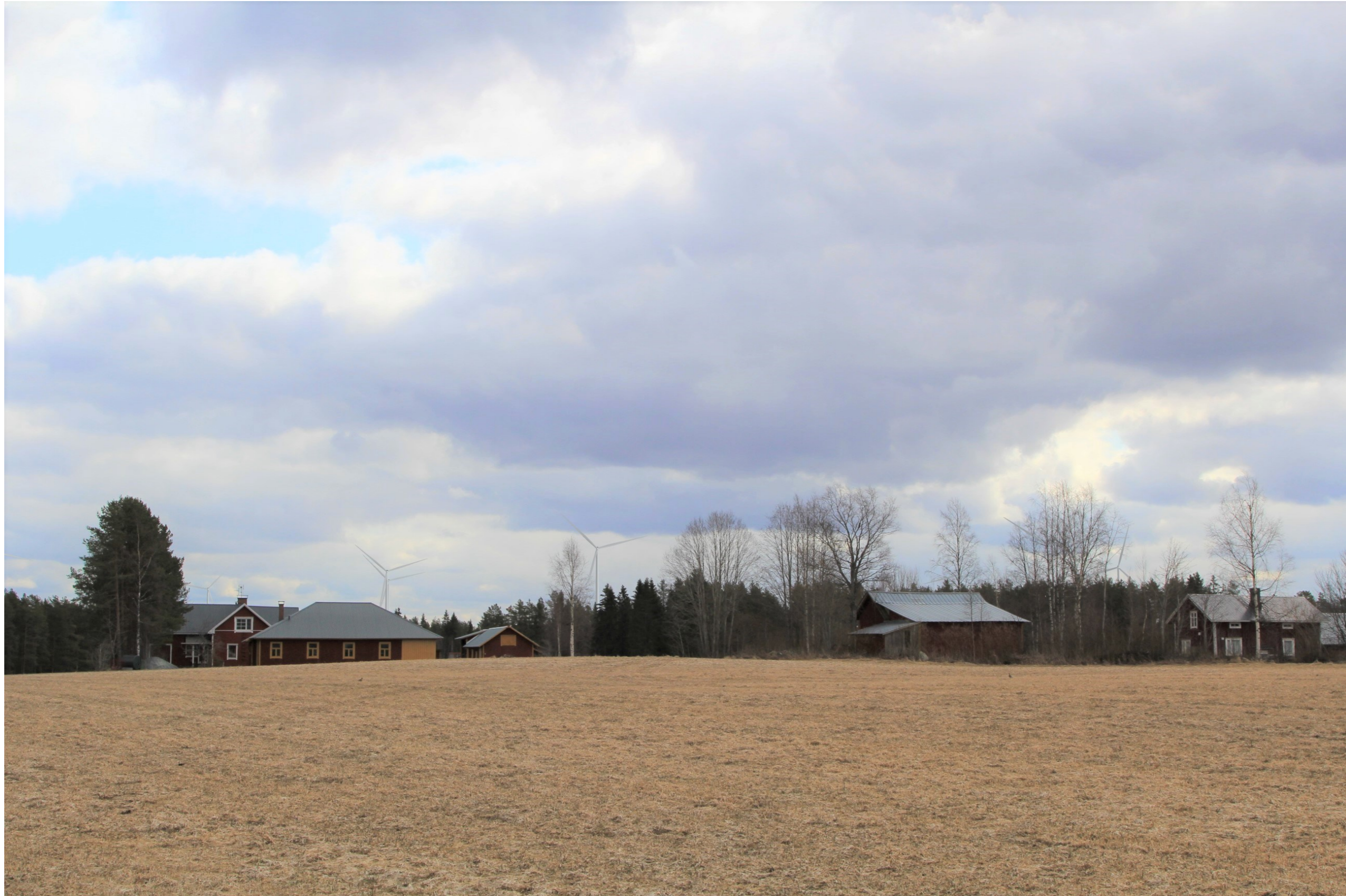
Kuva 5.1. Havainnekuva Hallaperältä. Etäisyys lähimpiin voimaloihin on noin 3,6 km. Kuvakulma vastaa kinofilmikoon 50 mm objektiivia.