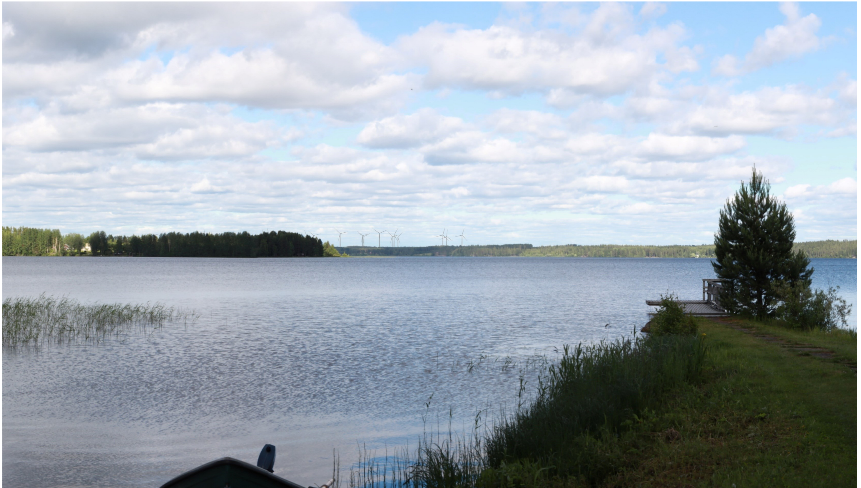
Kuva 8.1. Havainnekuva Ähtärinjärven rannalta. Etäisyys lähimpiin voimaloihin on noin 12 km. Kuvakulma vastaa kinofilmikoon 50 mm objektiivia.