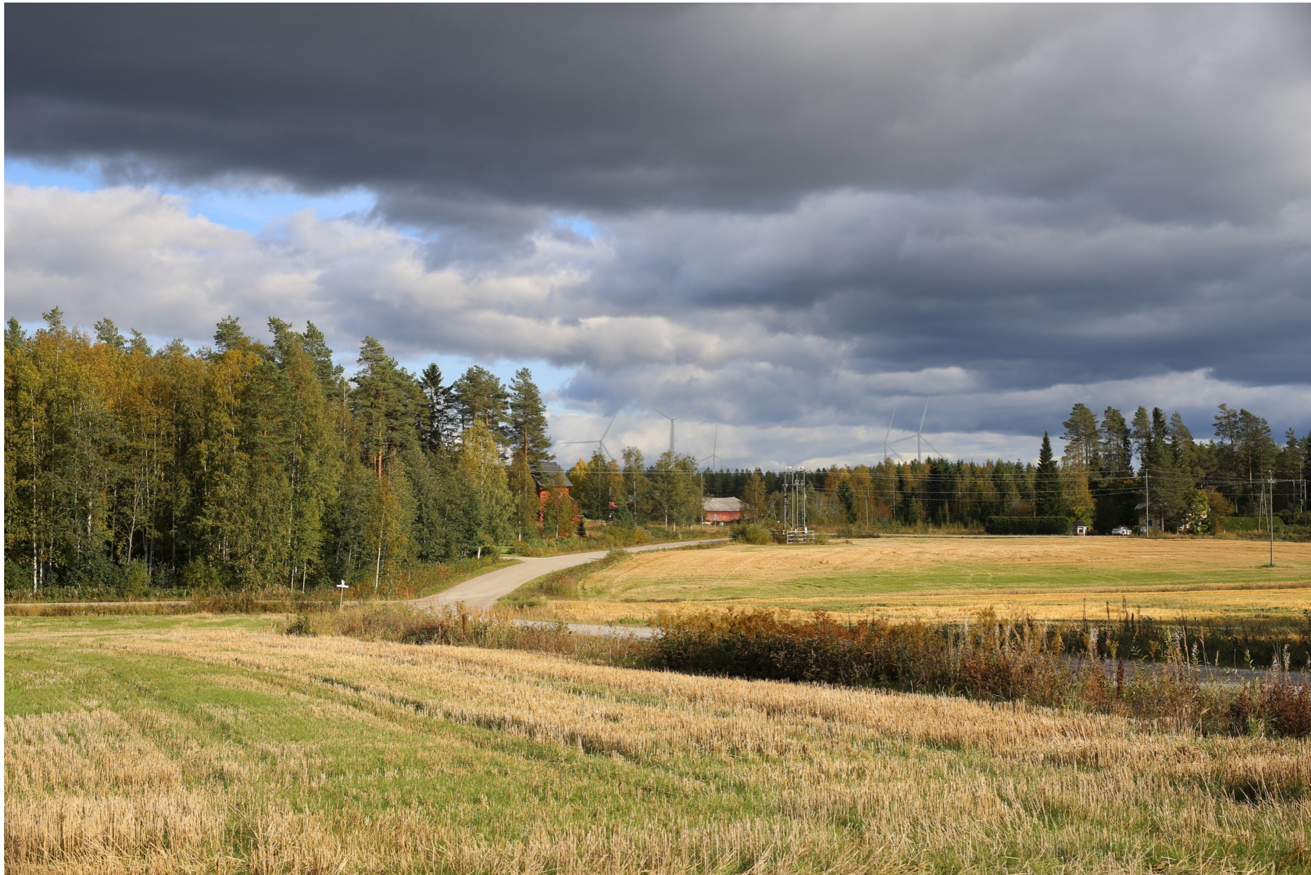
Kuva 4.1. Havainnekuva Hautakylästä. Etäisyys lähimpiin voimaloihin on noin 3,5 km. Kuvakulma vastaa kinofilmikoon 50 mm objektiivia.