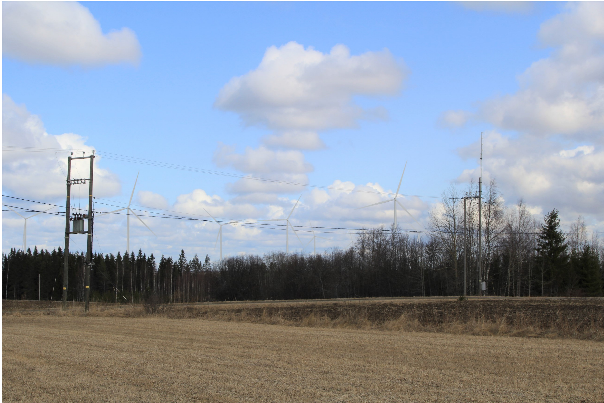
Kuva 3.1. Havainnekuva Kolusta. Etäisyys lähimpiin voimaloihin on noin 2,1 km. Kuvakulma vastaa kinofilmikoon 50 mm objektiivia.