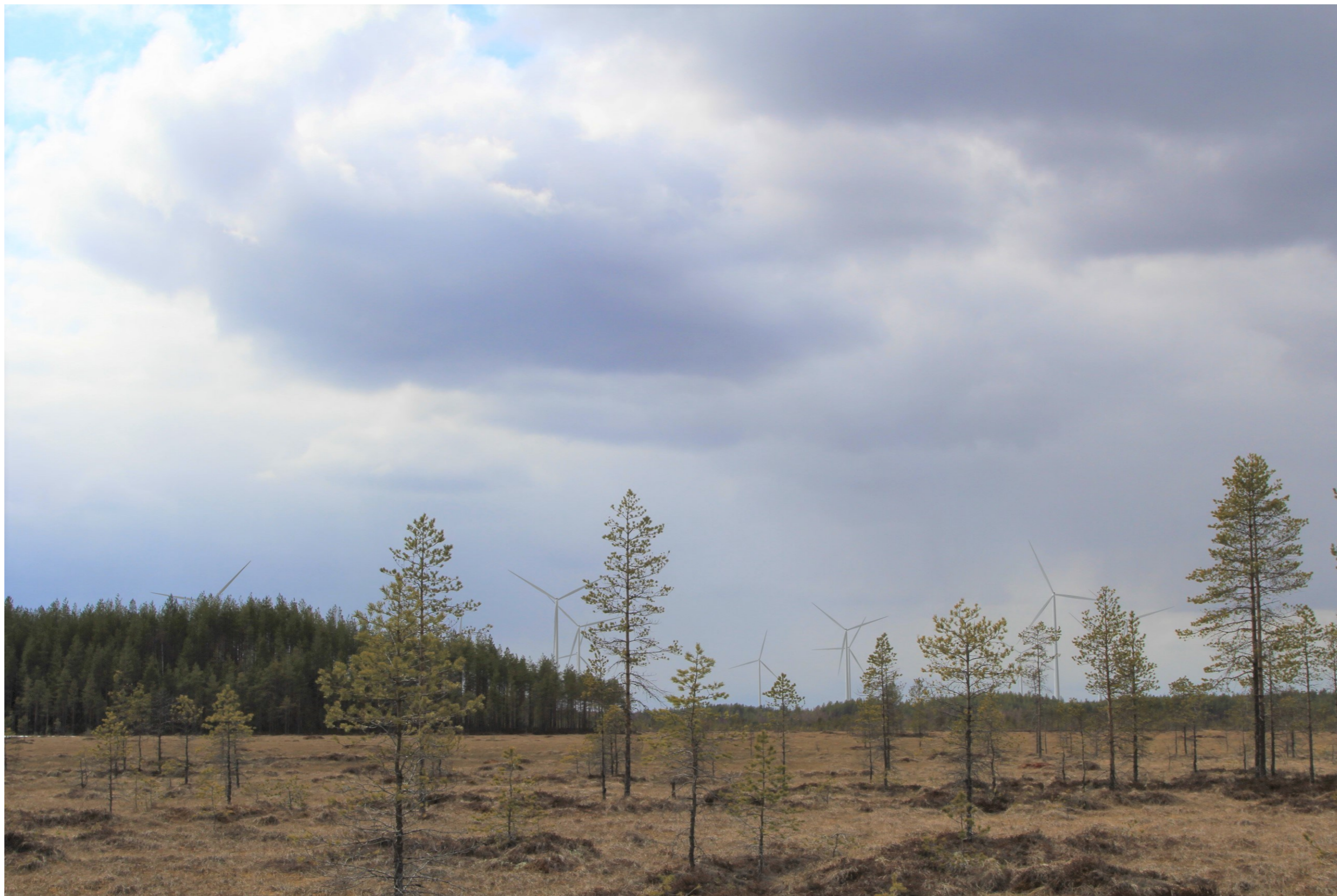
Kuva 1.1. Havainnekuva Arpaisten ulkoilureitiltä. Etäisyys lähimpiin voimaloihin noin 3,0 km. Kuvakulma vastaa kinofilmikoon 50 mm objektiivia.