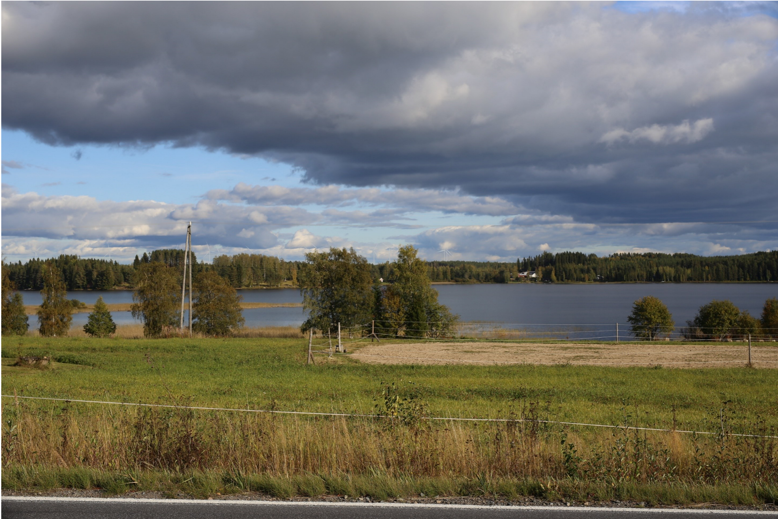
Kuva 7.1. Havainnekuva Ähtärinjärveltä. Etäisyys lähimpiin voimaloihin on noin 10 km. Kuvakulma vastaa kinofilmikoon 50 mm objektiivia.