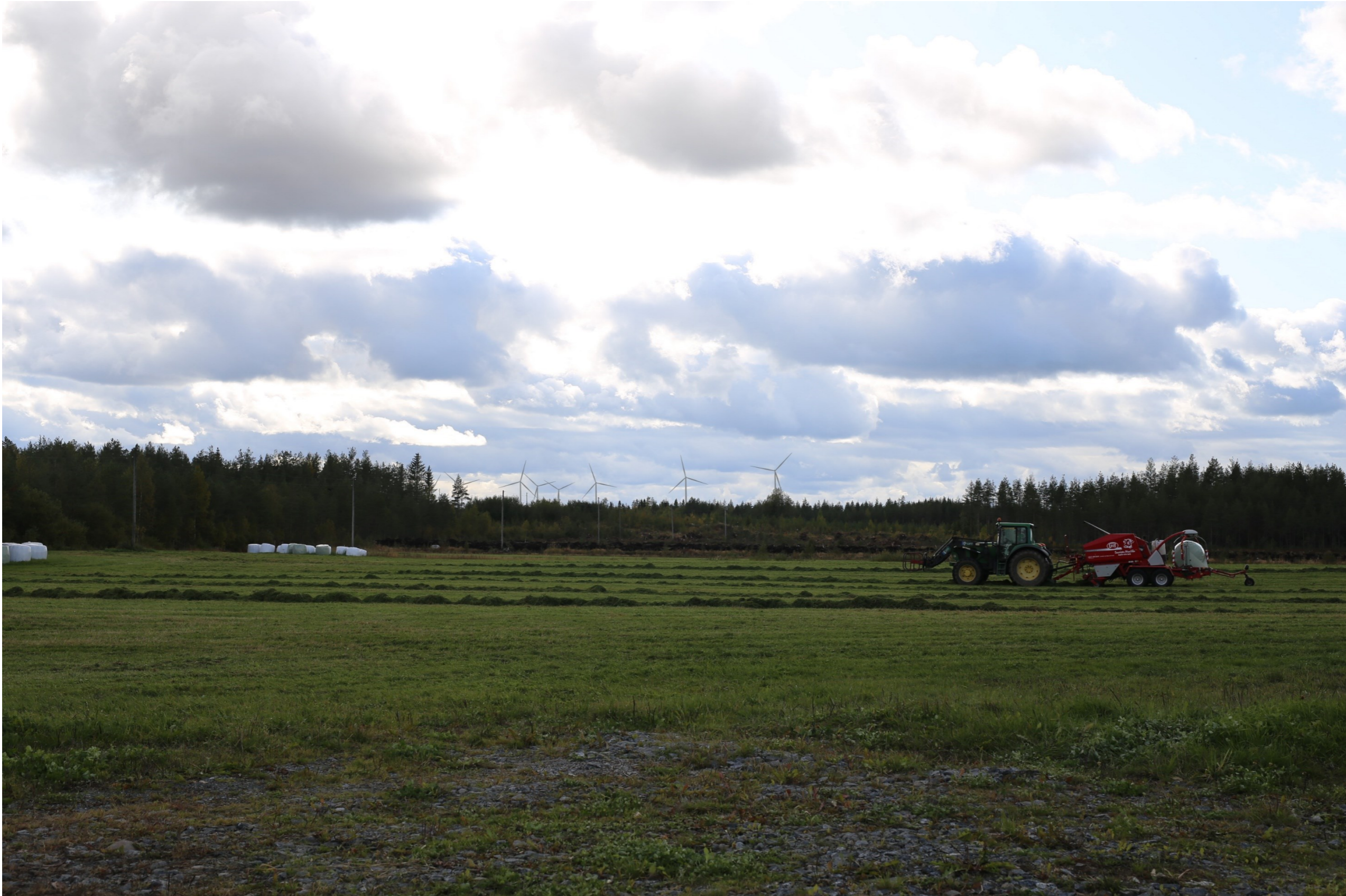
Kuva 6.1. Havainnekuva Parviaisenkylältä. Etäisyys lähimpiin voimaloihin on noin 8,5 km. Kuvakulma vastaa kinofilmikoon 50 mm objektiivia.