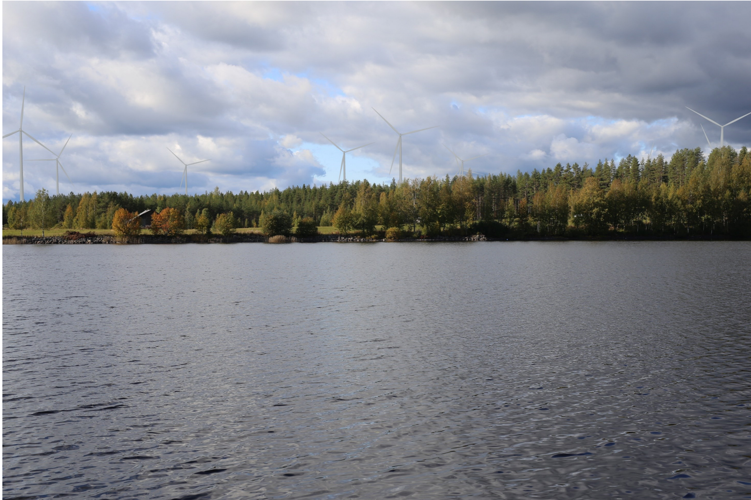
Kuva 2.1. Havainnekuva Isojärveltä. Etäisyys lähimpiin voimaloihin on noin 1,7 km. Kuvakulma vastaa kinofilmikoon 50 mm objektiivia.